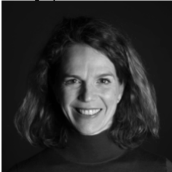
Pauline Huguet Assist. mise en scène & chorégraphie

Pauline Huguet est née et a grandi dans le sud de la France. Après une formation en danse classique au Conservatoire de Montpellier et des études de littérature anglaise (Master à l'Université Paul Valéry), elle s'est formée à la danse contemporaine et à la chorégraphie à l'école Laban de Londres (BA Hons Dance Theatre, 2000-2003). Pendant plus de 10 ans, Pauline a travaillé en freelance à Londres, en tant que danseuse, comédienne et chorégraphe. Elle a dansé ou collaboré avec de nombreuses compagnies, en particulier avec les compagnies de danse théâtre DV8, Protein, et la compagnie de théâtre immersif Punchdrunk. Elle a obtenu le Diplôme d'Etat de Professeur de Danse (section contemporaine) au CND de Paris en 2010.